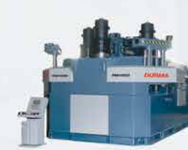
PROFİL BÜKME MAKİNASI