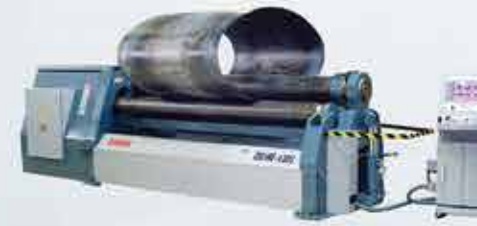
SİLİNDİR BÜKME MAKİNASI