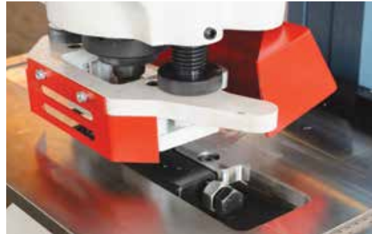
NPU-NPI ve Flanş Delinmesi