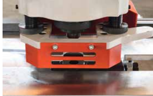
Düz Sac Delme