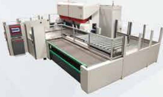
CNC BÜKÜM MERKEZİ