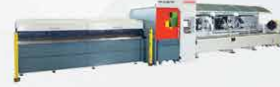
PROFİL BORU KESME MAKİNASI