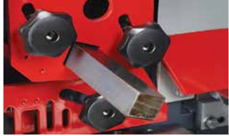
Kare Profil Kesme

İsteğe bağlı olarak U ve I & T kesim de mevcuttur.