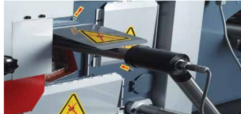
Otomatik Elektrikli, Dokunduğunda Kesme İşlemi Yapan Arka Dayama