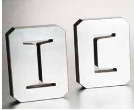
Opsiyonel I&T Bıçağı