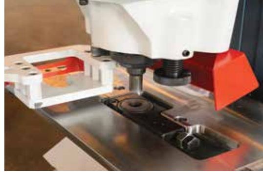
Kolay Açılabilen Sıyrıcı Sistemi

Delik delme istasyonu kafa kısmındaki çok kullanımlı olması için tasarlanmıştır. Çalışma tablasının dizaynı geniş kullanım imkânı sağlamaktadır. Bu düz plakaların delinmesini, flanş, aç ve kanallar buna dahildir. Bu istasyon standart olarak çabuk değişebilen alt ve üst kalıp tutucularıyla birlikte verilmektedir, buna kolay çıkarılabilen sıyrıcılar da dahildir. Buna ayrıca yatay ve dikey dayamada dahildir. Bu özellik genellikle tekrarlanarak kullanılan parçalar için çok uygundur. Delik delme istasyonunda farklı ölçülerde delik delinebilmektedir ve bükme aparatı sayesinde sac bükümü de yapılabilmektedir.