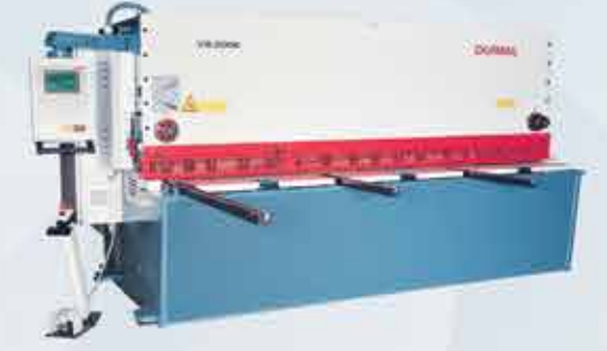
HİDROLİK AÇI AYARLI MAKAS