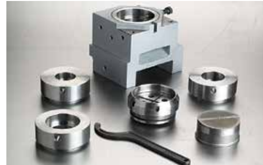
Farklı Ölçülerdeki Zimba ve Matris Seçimi