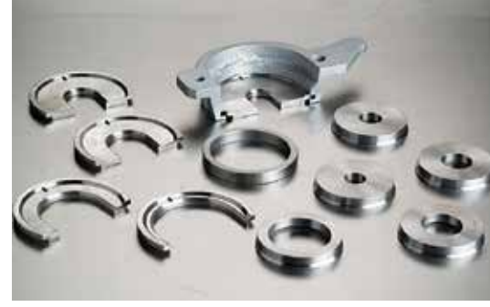
Farklı Ölçülerdeki Alt ve Üst Kalıplar