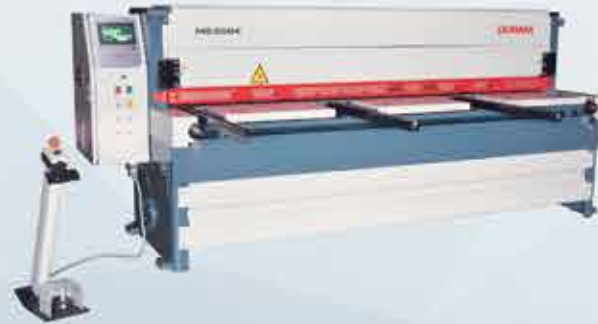
REDÜKTÖRLÜ GİYOTİN MAKAS