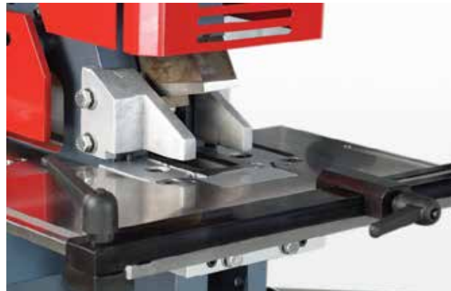
Üçgen Köşe Kesme (opsiyonel)