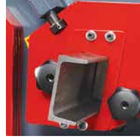
Opsiyonel U Profil Bıçağı