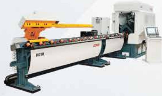
KÖŞEBENT KESME MAKİNASI