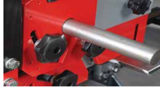
Yuvarlak Profil Kesme