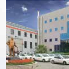
Satış Sonrası Hizmetler