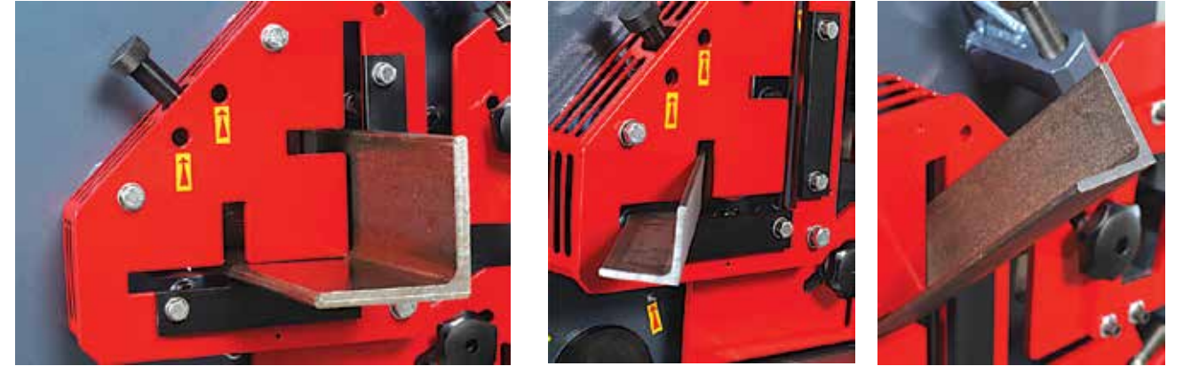
45° ve 90° kesme işlemi

Bıçaklar dört taraflı olup kolaylıkla takılabilir ve çevrilebilir özelliklerdedir. Kolay adapte edilen tutucular sayesinde düzgün kesme işlemi sağlanmış olur.