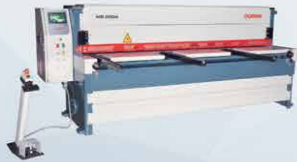
REDÜKTÖRLÜ GİYOTİN MAKAS