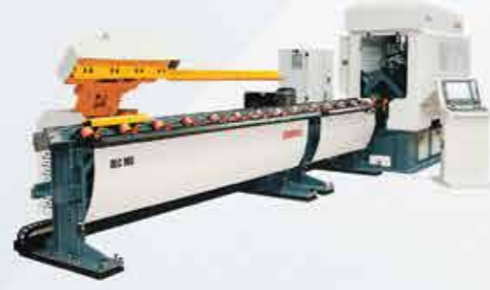
KÖŞEBENT KESME MAKİNASI