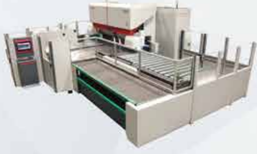
CNC BÜKÜM MERKEZİ