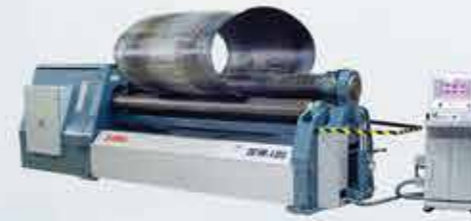
SİLİNDİR BÜKME MAKİNASI