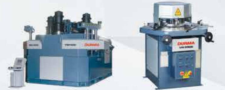
PROFİL BÜKME MAKİNASI