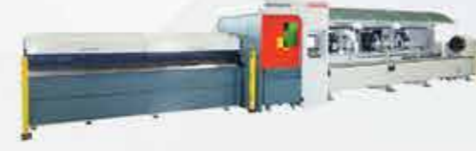
PROFİL BORU KESME MAKİNASI