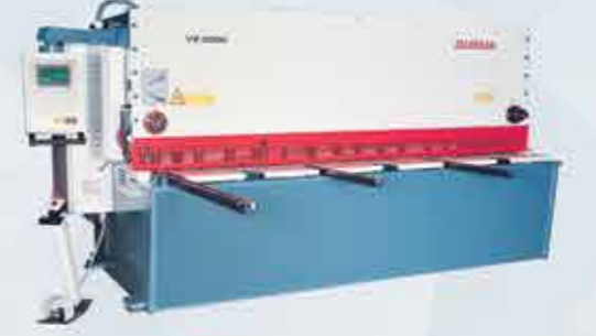
HİDROLİK AÇI AYARLI MAKAS